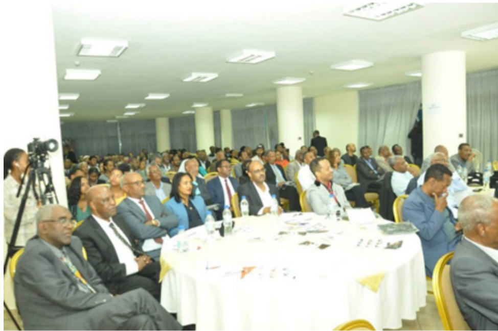
ከ ገጽ 4 የዞረ

አዲስ ቻምፒዮን በቅርቡ በጀመረው “የሥራ መሪዎች መድረክ” ገገግጅት ላይ ተገኝተው ለረጅም አመታት በኩባንያ መሪነት ያካበቱትን የረጅም ጊዜ ልምድ፣ ያጋጠሙባቸው ፈተናዎች፣ ፈተናዎችን በጥበብ አልፈው ለስኬት ካበቁባቸው ብልሃቶች፣ እንዲሁም የዘመናዊ የመሪነት ፍልስፍና እና መሠረታዊ ደንብ ለበርካታ ወጣት የኩባንያ መሪዎች እና ለታዳሚዎች