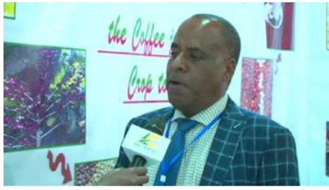
...ነከገሬችን ሳንመጣ ነና ተጨማሪ ገንዘብ ሳንመጣ ነገላዎን ዘረድ ነገላዎን ደንበኞች ጋር መገናኘት ትኩረት (ምክር ዳኛ (ከአዳማ ጉ.የተ.የግ, ማክ))

ለእነዚህ የሚሆኑ ዘይቶች እና ማለስለሽ ቅባቶች እናቀርባለን። በኢትዮጵያ ሰፊ ገበያ እንዳለ አውቀናል። ስለዚህ በቀጣይ ገበያችንን ለማስፋት እንፈልጋለን። በርካታ ደንበኞች ጋር ተገናኝተናል። እስከ አሁን ያለው ነገር ጥሩ ነው።