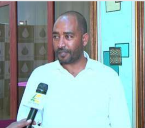
አሳምነው አብይ(ዶ/ር) -ከቫይታል አርት ኩባንያ

“ከተባባሪዎቻችን ጋር ያለንን ትእዛዝ ጤነኛ የሚያደርግ እና በቡድን መሥራትን የሚያዳብር ነው”