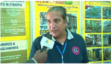
... ነዳማ ካይ ነንድ የምግብ ዘይት ፈብሪካ ከማቋቋም ዕቅድ ነኝ (ቻንዳራ ጉፍት ፤ ገዖ ግፍፍ፤ ነክጌንዳ)

እኛ የተሰማራነው በምግብ ዘይት ማምረት ዘርፍ ላይ ነው። በነገራችን ላይ ጉዳይ የእንስሳት መኖር አና በቆሻሻ አወጋገድ ቴክኖሎጂ ሥራዎችንም ላይ ተሰማርተናል። በኢትዮጵያ ከ100 ሚሊዮን ሕዝብ በላይ ይኖራል። ይህ ቁጥር ለኛ ትልቅ ገበያ ነው። ከአዲስ አበባ በተጨማሪ አዳማ ላይ አንድ የምግብ ዘይት ፍብሪካ ለማቋቋም ዕቅድ አለን። እግረ መንገዳችን ኢትዮጵያ በውጪ ምንዛሬ የምታስገባውን የምግብ ዘይት በአገር ውስጥ አምርተን ለመተካት ጥረት አናደርጋለን። ዝግጅቱ መልካም ነው... በአዲስ ቻምፒዮን የንግድ ትራፊኮች ስንሳተፍ ቆይተናል። ዛሬም ቻምፒዮን ባመቻቸልን ዕድል ጥሩ ጥሩ ደንበኞችን አግኝተናል። ምርት እና አገልግሎታችንን ለብዙ ጎብኚዎች እያስተዋወቅን ነው። ከአዳማ ላይ ደንበኞቻችን ጋር ጥሩ የቢዝነስ ግንኙነት እንጀምራለን ብለን ተስፋ እናደርጋለን።