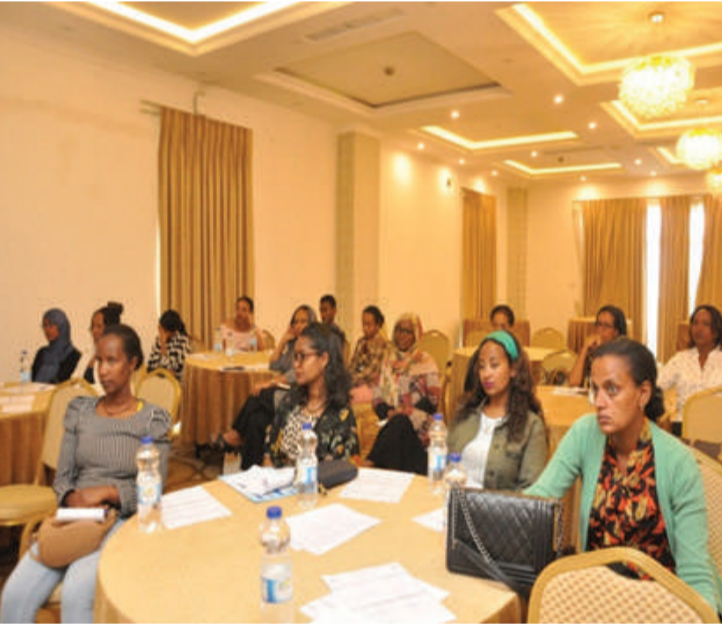
በመቶ ድርሻ ይይዛል።